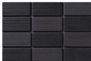
NT-452/ZA-800 (T:8.1RP3.2/0.3) (N:0.4R3.0/0.3)