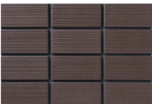
NT-452/ZA-700 (T:4.4YR3.6/0.9) (N:4.4YR3.4/1.0)