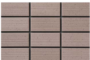
NT-452/ZA-600 (T:2.5YR5.3/1.1) (N:3.1YR5.1/1.1)