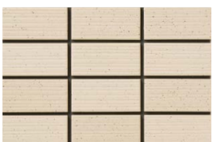
NT-452/ZA-200 (T:1.6Y7.7/1.4) (N:1.6Y7.5/1.5)