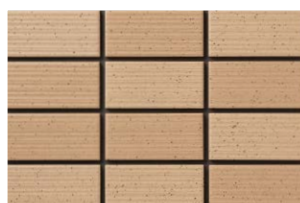
NT-452/ZA-400 (T:9.3YR6.1/2.8) (N:8.9YR5.9/3.0)