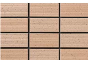
NT-452/ZA-300 (T:6.5YR6.5/2.5) (N:5.8YR6.3/2.9)