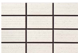
NT-452/ZA-100 (T:9.9YR8.2/0.8) (N:0.2Y8.1/0.7)

■濃:淡の均等ミックスです。 ■注意事項については、各カテゴリーの中扉に明記してあります。ご参照ください。また、詳しくは各営業までお問い合わせください。