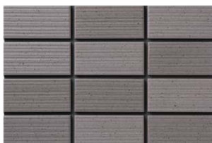
NT-452/ZA-500 (T:4.5YR4.8/0.3) (N:3.4YR4.5/0.3)