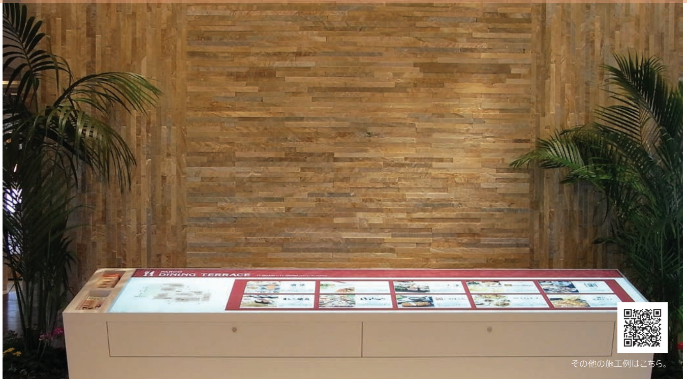
アーススティック