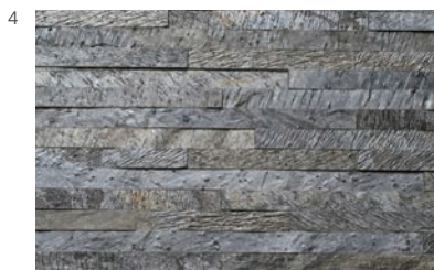
チャコールスティック