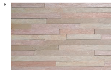
ピンクスティック