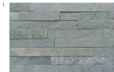
オリビア G スティック

■スティック材の役物はトメ加工になります。 ■注意事項については、各カテゴリーの中扉に明記してあります。ご参照ください。また、詳しくは各営業までお問い合わせください。 ■1㎡単位の出荷となります。 ■荷降ろしは車上渡しとなります。