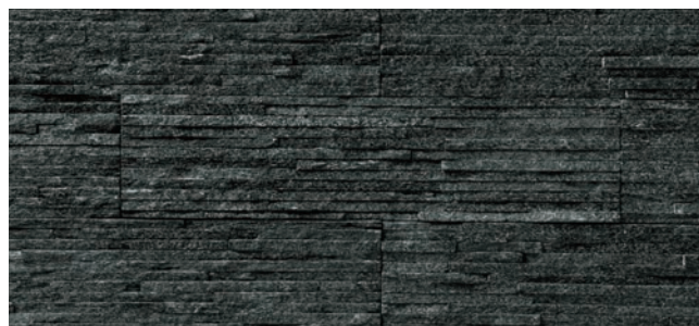
NS-P/SN-2-1 ブラック (N)