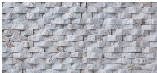
NS-P/SC-1-1 スノーホワイト (C)