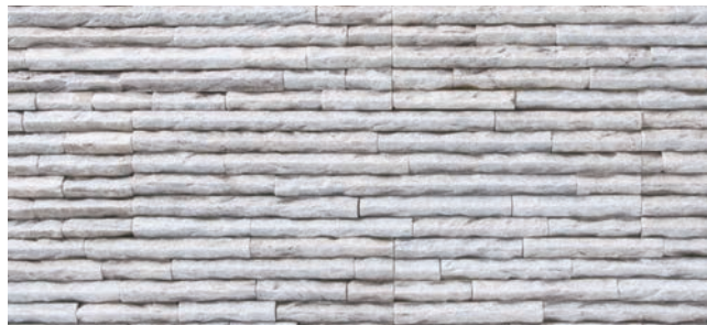
NS-P/SN-1-1 スノーホワイト (N)