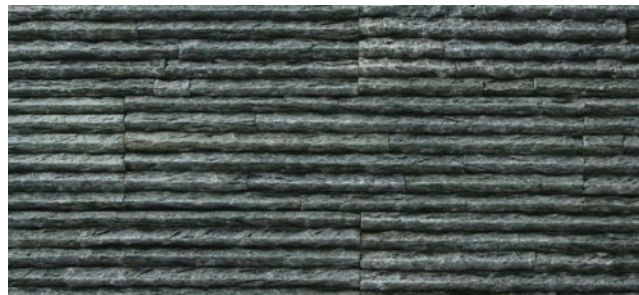
NS-P/SN-3-1 グリーン (N)