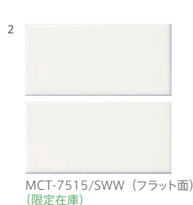
MCT-7515/SWW (フラット面) (限定在庫)