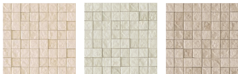
JUN II /MC-34 (ライトブラウン) JUN II /MC-35 (ライム) JUN II /MC-36 (コーラル)

「純・II」は漆喰内装材です。 土の恵にこだわった、人と環境に優しいエコ商品です。