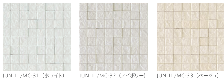
JUN II /MC-31 (ホワイト) JUN II /MC-32 (アイボリー) JUN II /MC-33 (ベージュ)