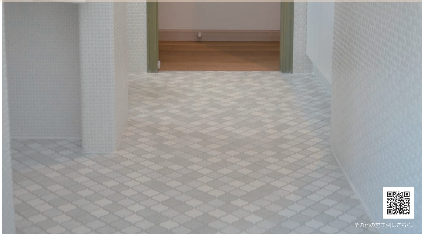
その他の施工例はこちら。