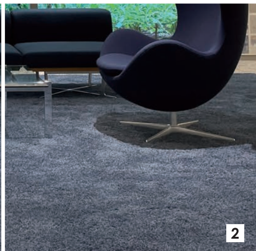
1 ~ 3 株式会社トーハン デザインディレクション:佐藤達郎 施工:鹿島建設株式会社 内壁:190角/90角/190x90角/190角レリーフ