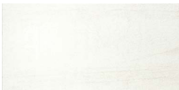
PC-36-417 (半磨き・ハニーミルク)