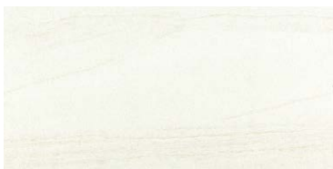
C-36-417 (石面・ハニーミルク)