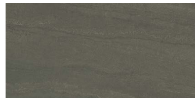
NF-1260/SOG-5 (ラフ) NF-1260/SO-5M (マット)