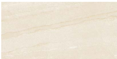
NF-1260/SOG-1 (ラフ) NF-1260/SO-1M (マット)