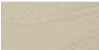
NF-1260/SOG-3 (ラフ) NF-1260/SO-3M (マット)