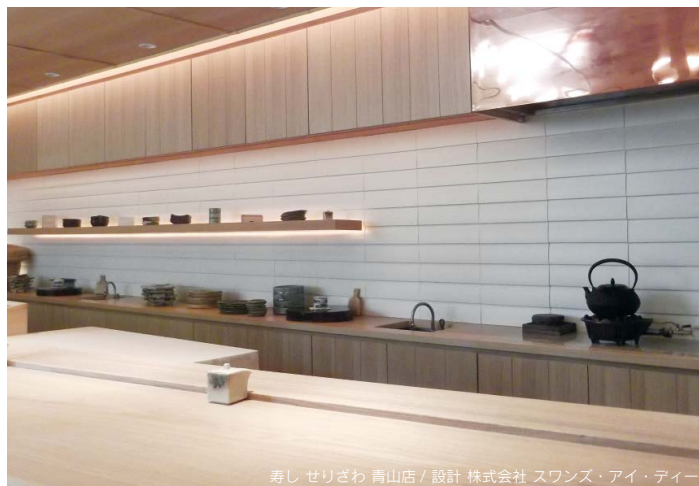
寿し せりざわ 青山店 / 設計 株式会社 スワンス・アイ・ティ