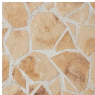
MS II -R/102