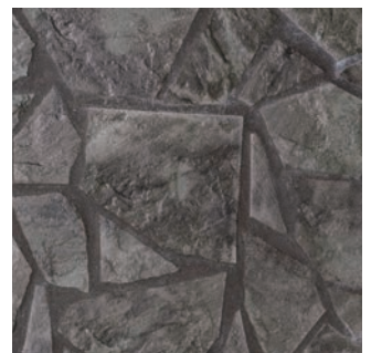
MS II -R/105