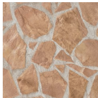
MS II -R/104