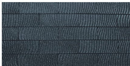
XG-310/012 パールブラック (ガラス)