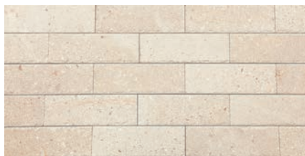
ROM-310B ロマネスク (石灰岩)