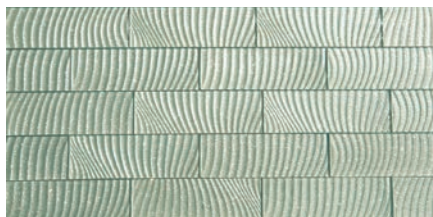
XG-310/011 パールシルバー (ガラス)