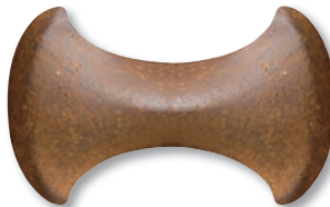
VCL-A-101 (Vintage) (無釉)