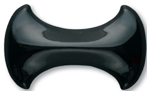
VCL-A-2 (Deep Black)