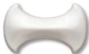
VCL-A-1 (Candy White)