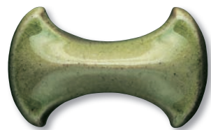
VCL-A-3 (Oribe Green)