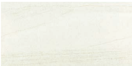
C-36-417 (石面・ハニーミルク)