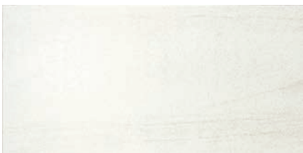
PC-36-417 (半磨き面・ハニーミルク)